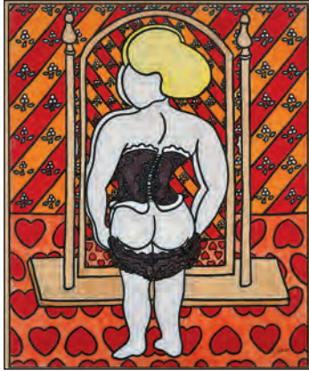
„Kiss me“, William N. Copley