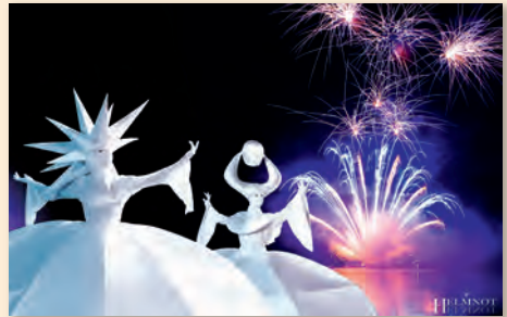
und Variete Act „HELMNOT“ – ein Garant für außergewöhnliche Inszenierungen weltweit